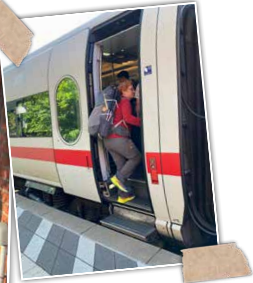
Der lange Weg zum Weg beginnt am 31. Mai 2023 in Höver, einem kleinen Dorf in der Lüneburger Heide. Mit dem Auto fahre ich zum Bahnhof, in Uelzen steige ich in den ersten einer Reihe von Zügen, die mich durch den Kanaltunnel bis nach London bringen werden.